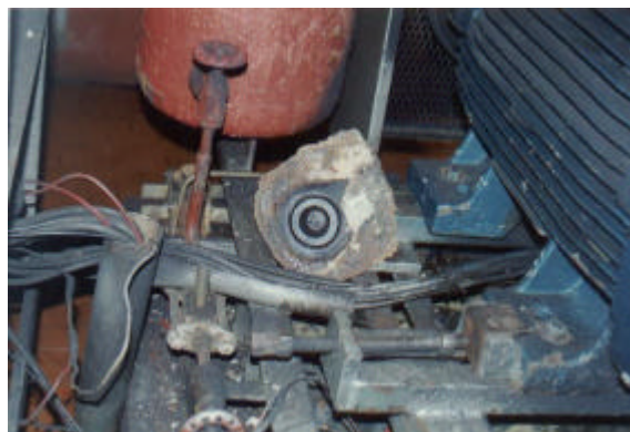
Figuras 10 e 11 – Tampa do compressor rompida

No entanto, o último fato deriva da existência prévia de uma série de fatores de risco, entre os quais destacam-se: