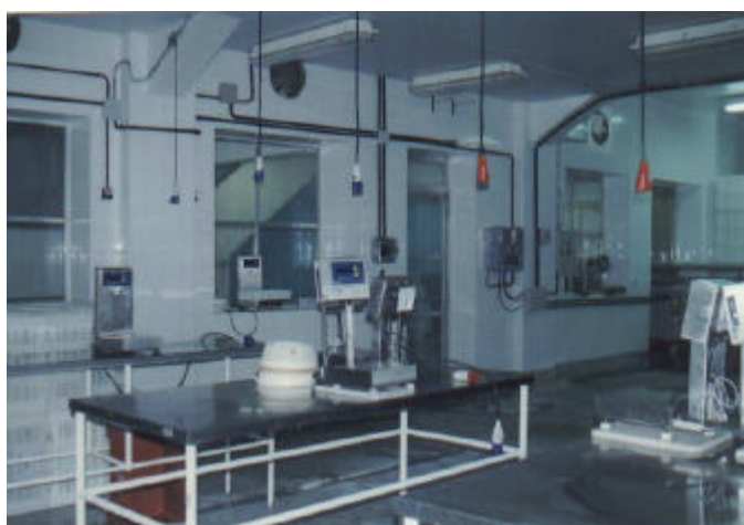
Figura 3 - Setor de produção da empresa

O sistema de refrigeração tem como equipamentos principais sete compressores, trocadores de calor, tubulações e acessórios. A quantidade de amônia no tanque de armazenamento é de 500 kg.