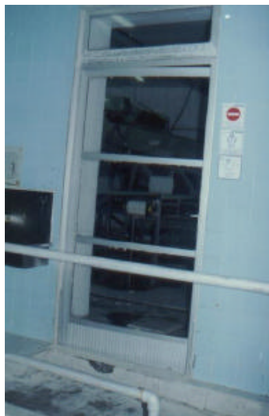
Figura 5 – Porta com lava-pés

Os empregados passaram, então, com as próprias mãos, a quebrar tijolos de vidro para entrada de luz existentes no alto das paredes dos fundos da empresa e telhas de amianto, na tentativa de sair pelo teto. A saída por essas vias anômalas causou outras lesões corporais em vários empregados, além das provocadas pela amônia. Um dos primeiros trabalhadores que escapou pelo teto, descendo por um poste de iluminação, pôde retornar à entrada principal da empresa, para auxiliar na desobstrução das demais saídas.