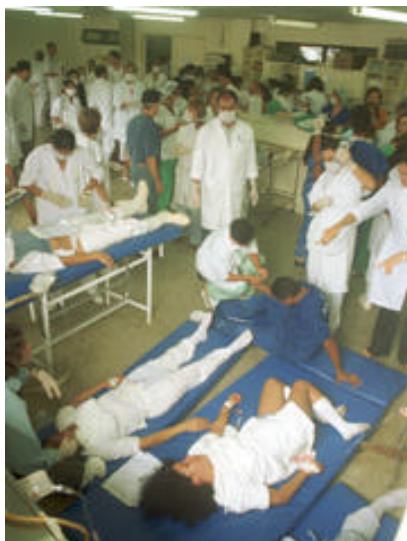
Figura 9 – Atendimento Médico

O acidente foi provocado diretamente pelo rompimento da tampa do cabeçote do compressor que apresentava alto grau de corrosão interna.