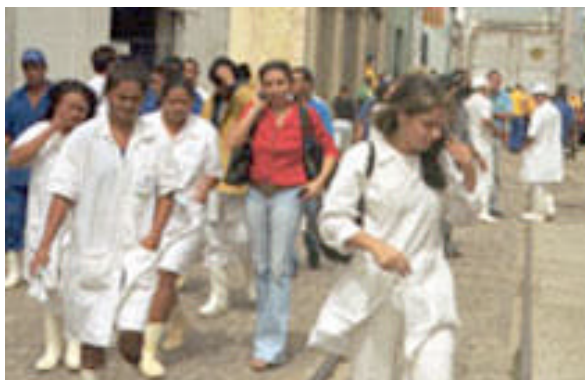
Figura 8 – Fuga dos trabalhadores

Como consequência da exposição prolongada à amônia, assim como dos demais riscos, houve dois óbitos e 127 vítimas, 18 delas afastadas por mais de 15 dias, 67 com afastamento inferior ou igual a 15 dias e 42 sem afastamento do trabalho. Ficou evidenciada, ainda, a fragilidade e o despreparo técnico dos serviços de saúde para lidar com este tipo de acidente, apesar de haver extremo esforço dos profissionais para o atendimento às vítimas.