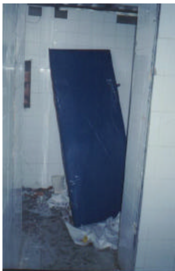
Figura 7 - Abertura forçada de porta de aço para fuga